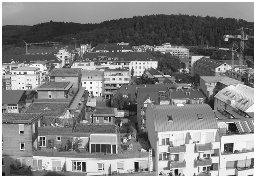
Französisches Viertel Tübingen